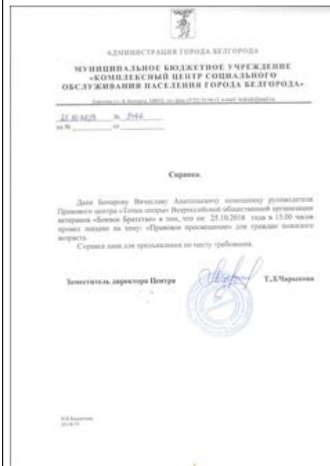
Правовой семинар для граждан пожилого возраста из числа Активистов территориальных округов Справка о проведении правового семинара