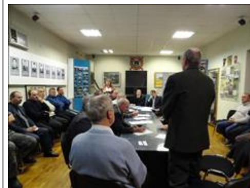
Правовой семинар с ветеранами ОМВД Новооскольского района Белгородской области Организаторы и участники семинара ведут дискуссию