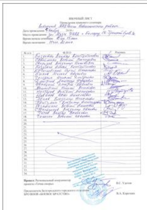
Правовой семинар с ветеранами ОМВД Новооскольского района Белгородской области Явочный лист