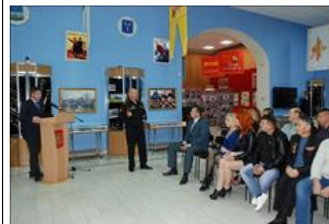
Правовой семинар для ветеранов и инвалидов боевых действий Астраханской области Дискуссия участников семинара