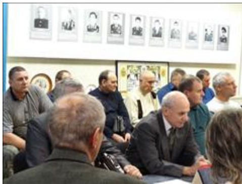
Правовой семинар с ветеранами ОМВД Новооскольского района Белгородской области Участники правового семинара - участники боевых действий

Количество публикаций за весь срок осуществления проекта