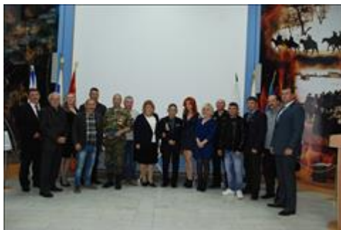
Правовой семинар для ветеранов и инвалидов боевых действий Астраханской области Общее фото участников и организаторов семинара