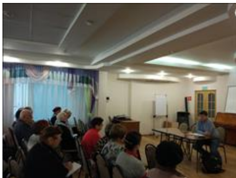
Правовой семинар для граждан пожилого возраста из числа Активистов территориальных округов Участники семинара внимательно слушают выступающего