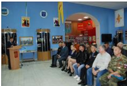
Правовой семинар для ветеранов и инвалидов боевых действий Астраханской области Выступление руководителя Правового центра "Точка опоры" на правовом семинаре в г. Астрахань