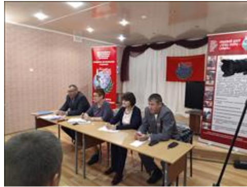
Выездной правовой семинар в г. Новокуйбышевк Самарской области Во время проведения семинара