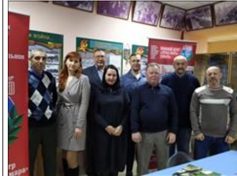
Выездной правовой семинар в г. Кинель Самарской области Руководство Кинельского местного отделения "Боевого братства", юристы ПЦ "Точка опоры - Самара" и специалисты органов социальной защиты населения перед началом мероприятия.