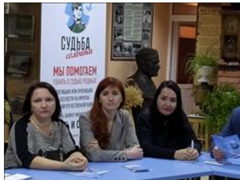
Выездной правовой семинар в г. Кинель Самарской области Представители органов социальной защиты населения г.о. Кинель и Пенсионного фонда, принявшие участие в семинаре, проводимом ПЦ "Точка опоры - Самара" СРО ВООВ "Боевое братство" в рамках проекта Президентского гранта.

Мероприятие: Внеплановый семинар для членов ветеранских организаций