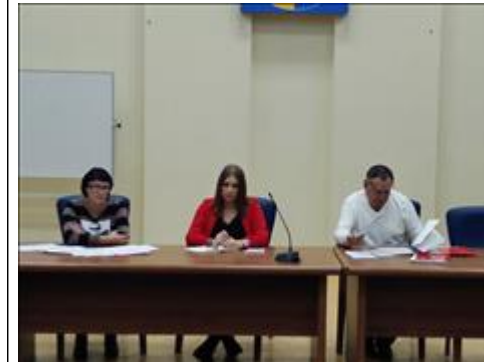
Выездной Правовой семинар в г. Тольятти Самарской области Представители Минсоцдемографии, Пенсионного фонда РФ и руководитель ПЦ "Точка опоры-Самара"