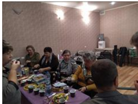
Выездной правовой семинар в г. Новокуйбышевск Самарской области Обмен мнениями во время кофе-брейка

Мероприятие: Плановый выездной семинар в г.Кинель Самарской области