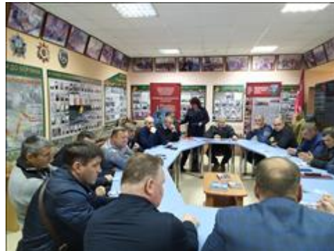
Выездной правовой семинар в г. Кинель Самарской области Рабочий момент правового семинара