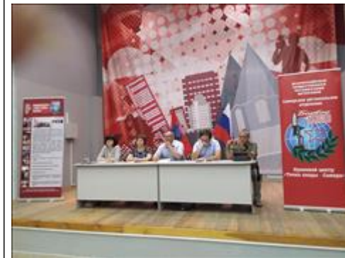
Выездной правовой семинар в г. Сызрань Самарской области Участники правового семинара