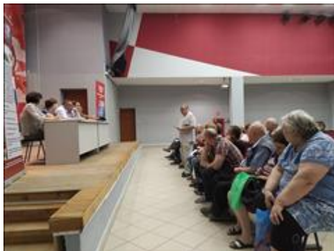
Выездной правовой семинар в г. Сызрань Самарской области Вопрос от участника семинара