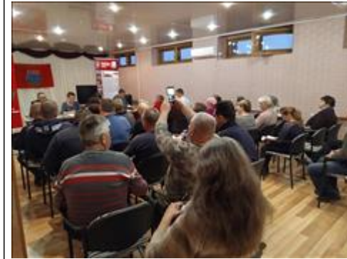
Выездной правовой семинар в г. Новокуйбышевск Самарской области Участники семинара