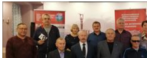
Внеплановый семинар для членов ветеранских организаций Участники семинара