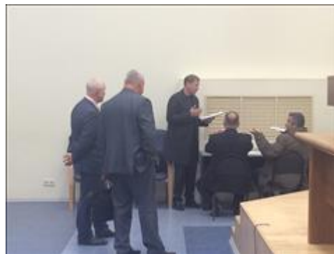
Выездной Правовой семинар в г. Тольятти Самарской области Обсуждение после проведенного семинара