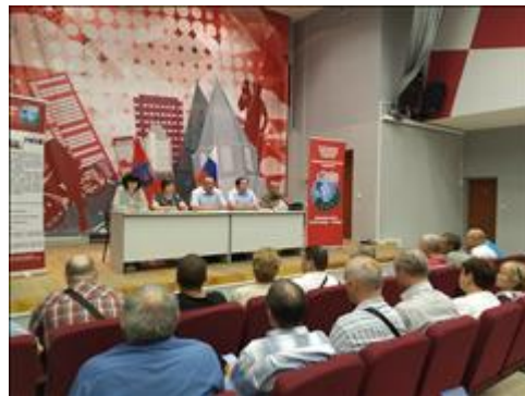
Выездной правовой семинар в г. Сызрань Самарской области Во время проведения семинара