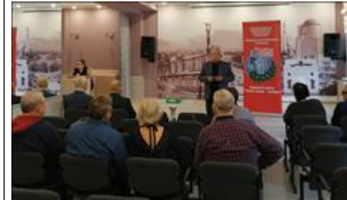
Внеплановый семинар для членов ветеранских организаций Рабочий момент семинара