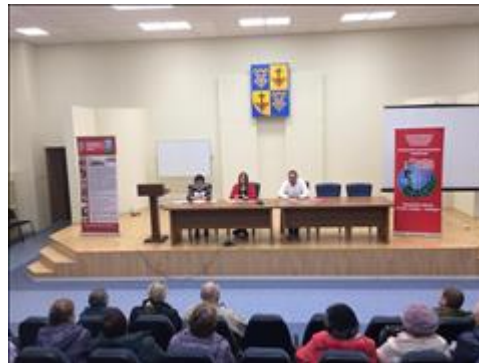
Выездной Правовой семинар в г. Тольятти Самарской области Участники Правового семинара