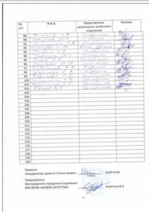
Правовой семинар для целевых групп проекта в г. Челябинске Явочный лист ч.4