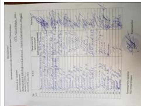
Правовой семинар для ветеранов боевых действий, г. Абакан Республика Хакассия Явочный лист №1