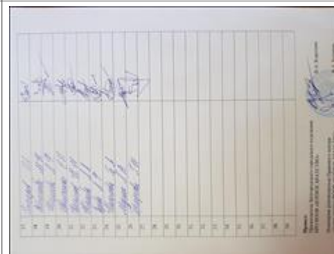
Правовой семинар в Яковлевском районе Белгородской области с ветеранами боевых действий Явочный лист №2

Мероприятие: Поведение правового семинара в п. Короча Белгородской области с ветеранами боевых действий и другими