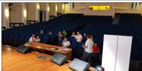
Правовой семинар в Яковлевском районе Белгородской области с ветеранами боевых действий Вопросы от ветеранов - ответы от организаторов