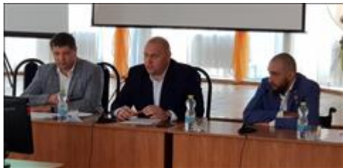
Правовой семинар в п. Ракитное Белгородской области с ветеранами боевых действий Вступительное слово главы администрации Ракитянского