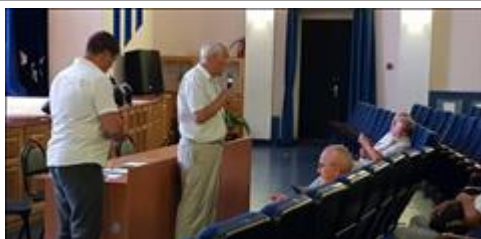
Правовой семинар в Яковлевском районе Белгородской области с ветеранами боевых действий Слова благодарности от руководителя ветеранской организации Яковлевского района Белгородской области