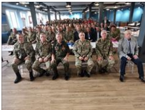
Правовой семинар для ветеранов боевых действий в г. Владивосток Приморского края Ветераны боевых действий - участники правового семинара

Мероприятие: Проведение правового семинара для ветеранов боевых действий в г. Владивосток Приморского края