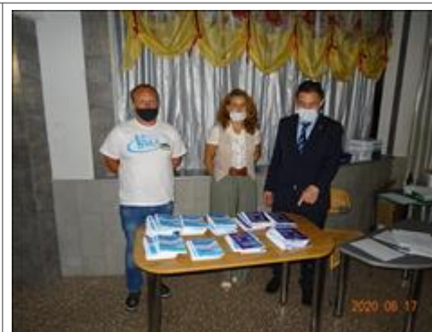
Правовой семинар для целевых групп проекта в г. Челябинске Во время семинара были презентованы методические