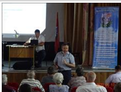
Правовой семинар для целевых групп проекта в г. Челябинске с информацией по теме правового семинара выступает

Мероприятие: проведение правового семинара для целевых групп проекта в г. Челябинске