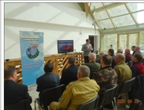
Правовой семинар для ветеранов боевых действий, г. Абакан Республика Хакассия Участники правового семинара