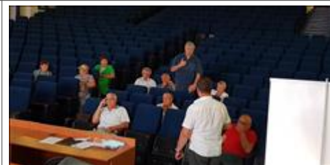
Правовой семинар в Яковлевском районе Белгородской области с ветеранами боевых действий Вопрос-ответ