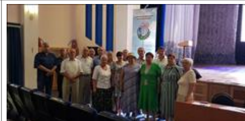
Правовой семинар в Яковлевском районе Белгородской области с ветеранами боевых действий Активные участники ветеранского движения Яковлевского района Белгородской области