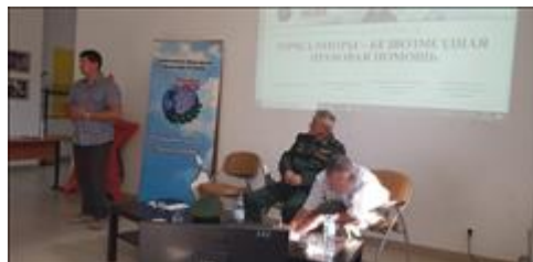
Правовой семинар в п. Короча Белгородской области с ветеранами боевых действий Руководитель правового центра информирует присутствующих о деятельности правового центра