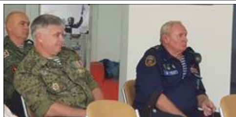
Правовой семинар в п. Короча Белгородской области с ветеранами боевых действий Участники семинара - ветераны военной службы и боевых действий