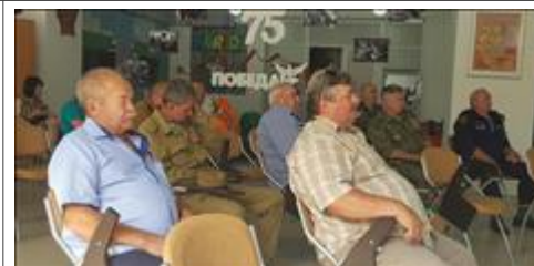
Правовой семинар в п. Короча Белгородской области с ветеранами боевых действий Участники семинара