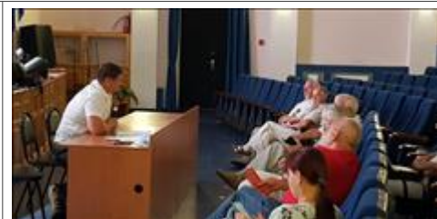
Правовой семинар в Яковлевском районе Белгородской области с ветеранами боевых действий Живое общение между организаторами и участниками семинара