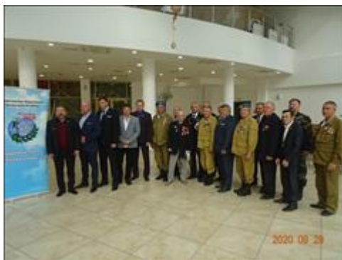
Правовой семинар для ветеранов боевых действий, г. Абакан Республика Хакассия Руководители территориальных ветеранских организаций Республики Хакассия на семинаре ПЦ "Точка опоры"