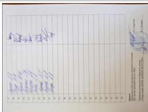
Правовой семинар в Шебекинском районе Белгородской области с ветеранами боевых действий Явочный лист ч. 2

Мероприятие: Поведение правового семинара в п. Строитель Яковлевского района Белгородской области с ветеранами боевых действий и другими целевыми группами проекта