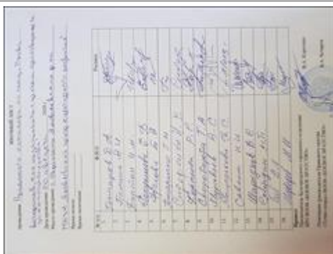
Правовой семинар в Яковлевском районе Белгородской области с ветеранами боевых действий Явочный лист №1